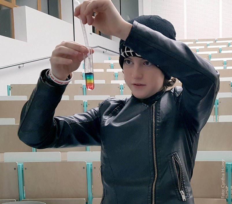
WORKSHOPS | Ab Klasse 7