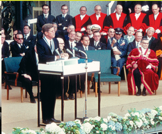
Philologische Bibliothek der Freien Universität, eröffnet 2005 Eröffnungsfeier der Freien Universität Berlin am 4. Dezember 1948 im Titania-Palast