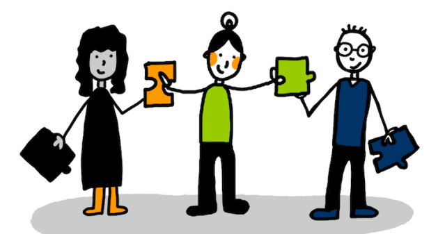
Community of Practice

Bestehende Qualifizierungsangebote werden bedarfsorientiert ergänzt. Die Tutor*innen und Mentor*innen bringen Themen selbstbestimmt ein und gestalten das Format, angepasst an ihre Bedarfe und Interessen, eigenständig. Sie bilden eine Community of Practice .