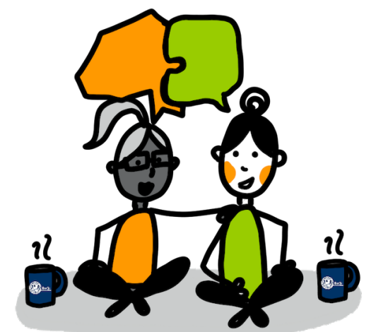
Austausch mit anderen Tutor*innen

Tutor*innen unterschiedlicher Hochschulen und Universitäten beraten sich kollegial, diskutieren, geben Wissen und Erfahrungen weiter und vernetzen sich. Best-Practice-Beispiele werden aufgezeigt und gescheiterte Lehrvorhaben gemeinsam reflektiert.