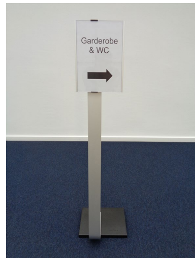
Informationsdisplay vor dem Max-Kade-Auditorium und Bodenaufsteller.