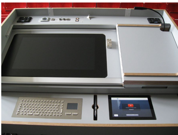
Rednerpult mit Touch/Pen-Display, PC-Tastatur und Extron- Mediensteuerungstouchpanel