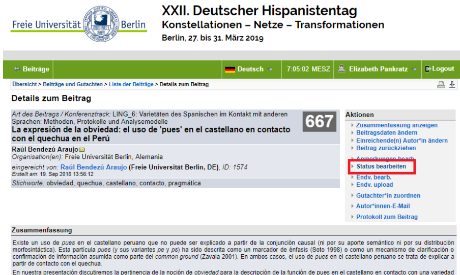
Abbildung 2. Screenshot der Seite Details zum Beitrag mit dem Link Status bearbeiten hervorgehoben.

In der Aktionen-Box oben rechts auf der Seite sind mehrere Links aufgelistet. Klicken Sie auf Status bearbeiten .