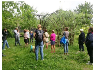
Im Garten des Paulsen Gymnasiums