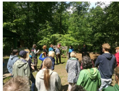
Umweltsenatorin Bettina Jarasch in der Waldschule

Seit mittlerweile (mehr als) 25-Jahren rückt das Team der Waldschule Zehlendorf für Schulen aller Schulstufen, Familien und weitere Interessierte eindrucksvoll den Wald in den Mittelpunkt. In den Mittelpunkt des Sehens, Fühlens, Riechens, Hörens und Sehens. So werden nicht nur die Sinne geschult, Schritt für Schritt wird auch der Mensch in