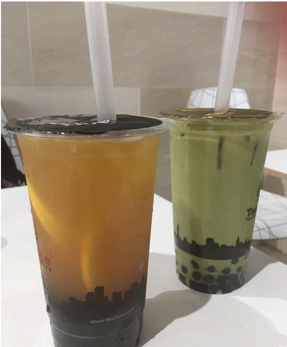
BERKELEY IST SEHR ASIATISCH GEPRÄGT: BOBA IST DAS BELIEBTESTE GETRÄNK

die von Studenten unterrichtet werden. Es gibt Kurse, in denen man gemeinsam bäckt oder über die politischen Theorien in Game of Thrones diskutiert. Diese Kurse bieten ein oder zwei Units und bieten eine gute Gelegenheit, Lehre mal anders zu erleben. Ich habe im ersten Semester einen Slum DeCal belegt und da ich bereits in Slums in Indien und Argentinien gearbeitet hatte, bewarb ich mich, um diesen Kurs im nächsten Semester zu unterrichten. Ich erhielt die Stelle und belehrte 30 Studierende zu dem Thema "Health and Human Rights in Slums". Es war eine grandiose Möglichkeit, die eigenen Fähigkeiten in einem sicheren Umfeld auszutesten.